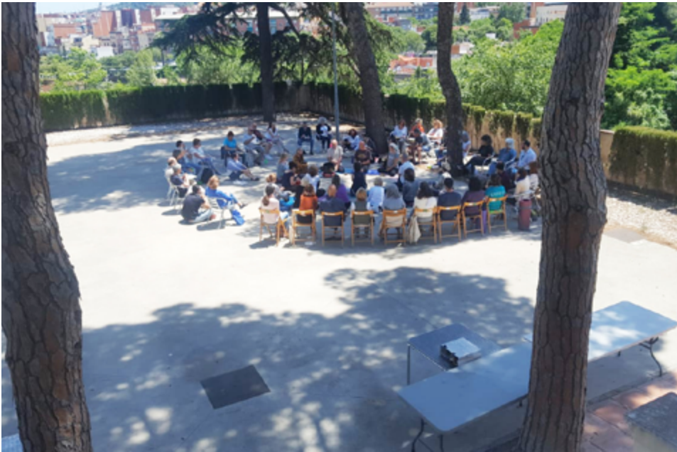
Vesak Saga Dawa 2019.