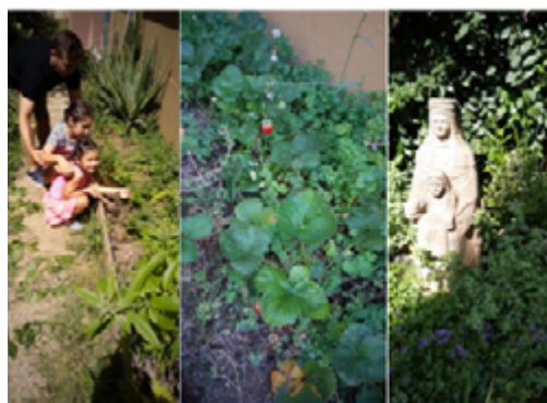
Imatges del jardí de la parròquia.