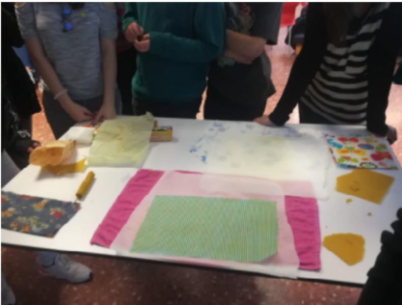
Taller d'embolcalls per tal de reduir els residus de l'esmorzar.

https://sites.google.com/a/fje.edu/plantem-treballem-i-recollim/home