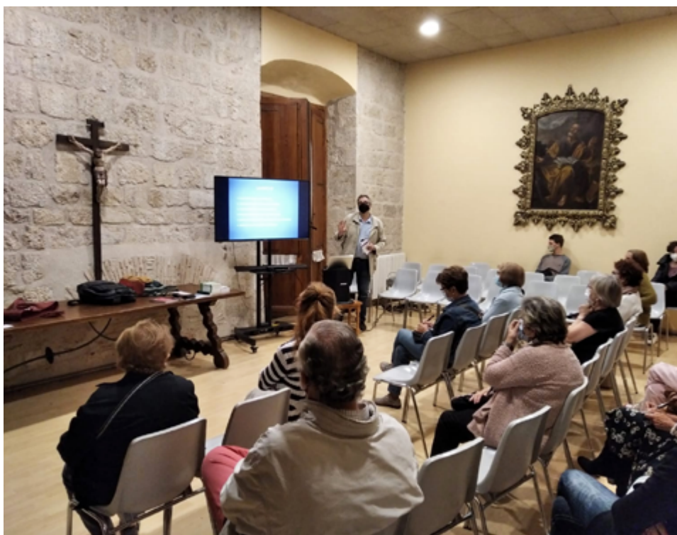
La parròquia va crear un grup de reflexió al voltant de l'encíclica del Papa Francesc Laudato si'.

https://santperedoctavia.org ; laudatosi@santperedoctavia.org