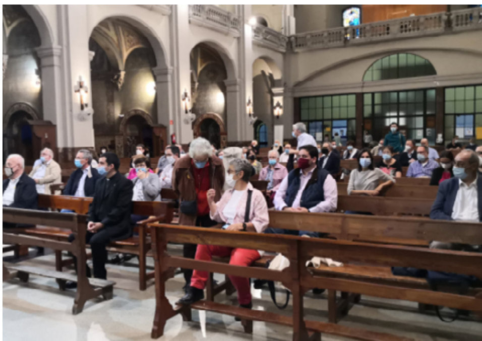
Assistents al Jubileu per la Terra.

https://www.catalunyareligio.cat/ca/centenar-cristians-demanen-sabat-terra