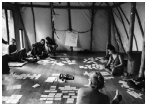
Curs al Centre Dharma.