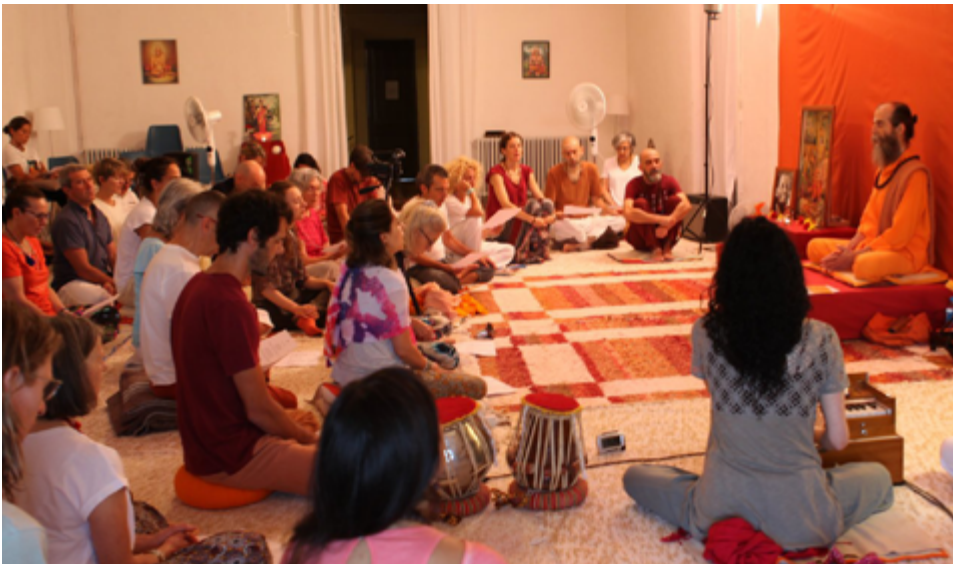
Recés de ioga a Besalú.