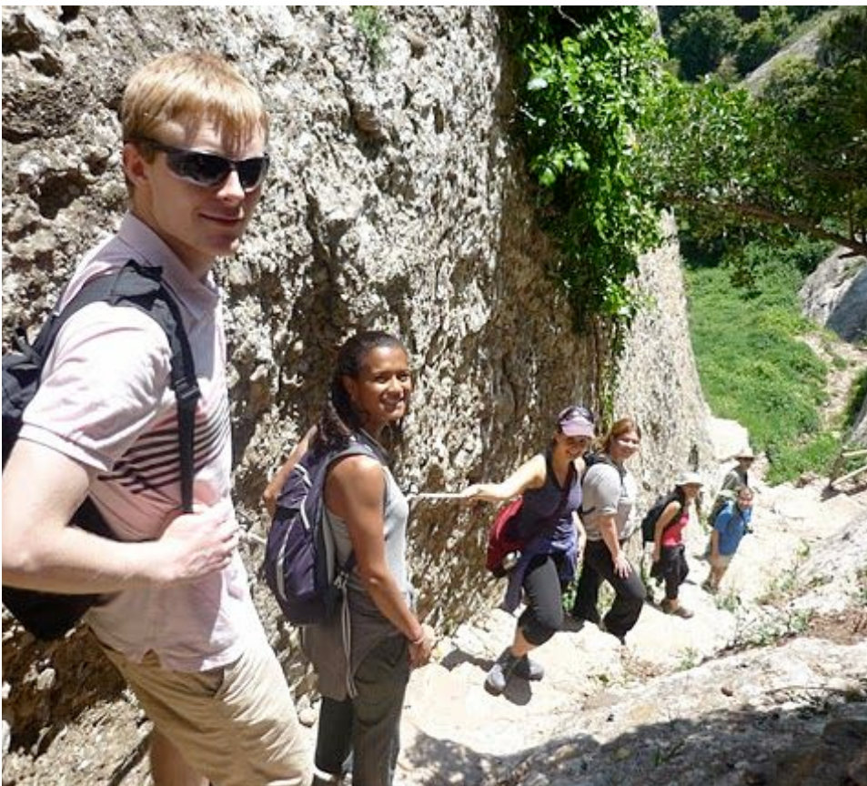
Excursió a Montserrat organitzada per la comunitat Bahá'í de Barcelona.