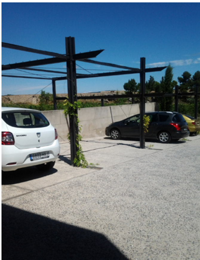
L'aparcament tindrà coberta vegetal.