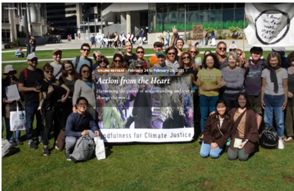
Anunci d'un recés online per activistes climàtics.