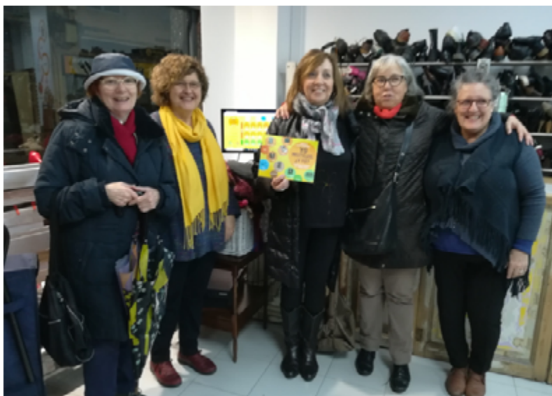
Les voluntàries de la campanya "Jo reutilitzo, i tu?" explicaven els beneficis mediambientals i socials que suposa el consum responsable.