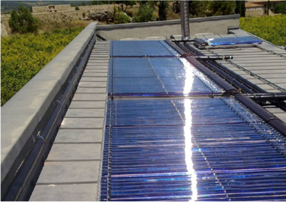
Teulada fotovoltaica al sostre del Palau de l'Abat del monestir de Poblet.