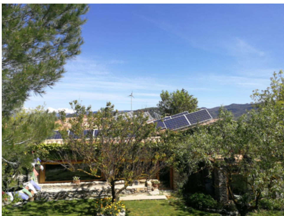
Plaques fotovoltaïques a Casa Virupa.