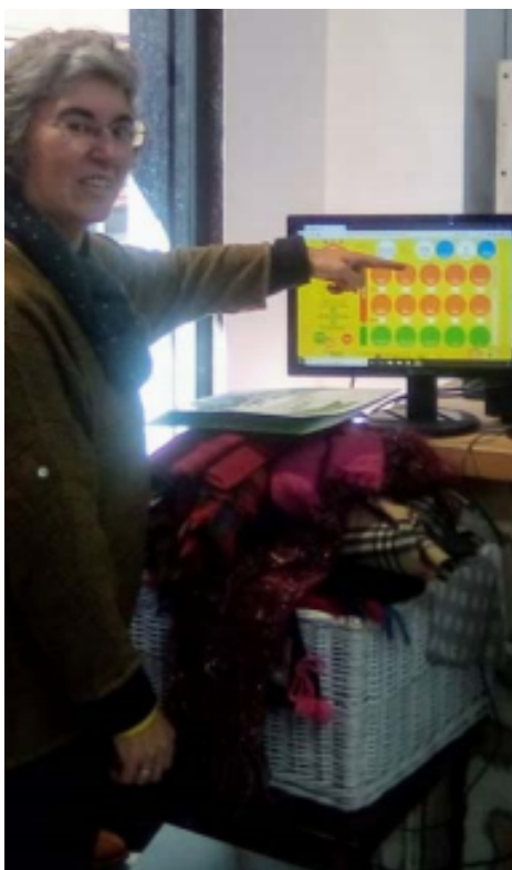
Calculadora de CO2.

http://reutilizayevitaco2.aeress.org/cat/