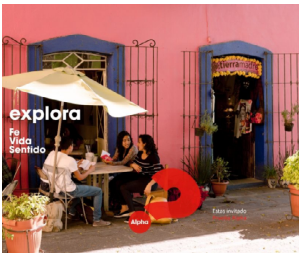
Rètol dels Cursos Alpha que es fan a Sant Quirze del Vallès.