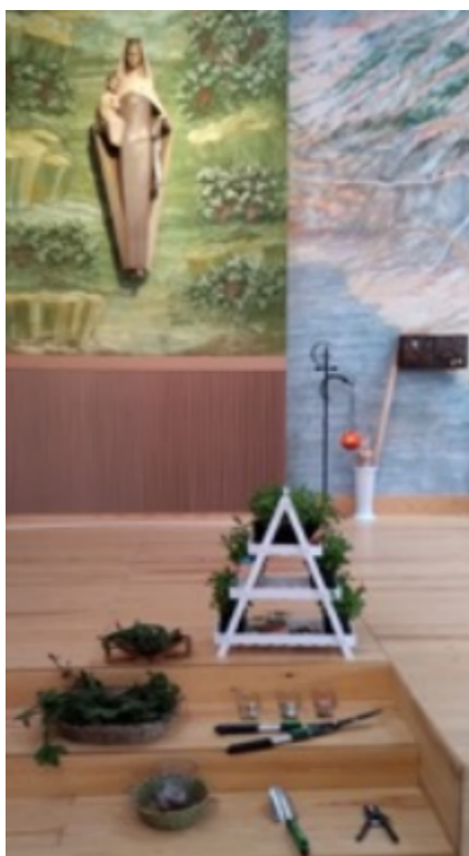
L'interior de l'església el diumenge, amb els estris del jardí.

Carrer Josep Maria Trias de Bes, 9. 08970 Sant Joan Despí. Barcelona.