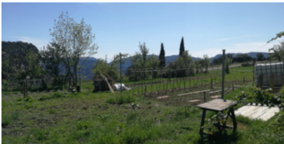
Hort de Casa Virupa actualment.