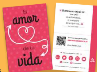
Día de los enamorados

LÍDER: Pidan a Dios el valor de Cristo para compartir con otros lo que Él está haciendo en su vida. Oren. Pidan a Dios que los guíe por medio del Espíritu Santo hacia alguien que necesite escuchar su propia historia de lo que Jesús está haciendo en su vida. ¡Compartan a Jesús con esa persona! En preparación para mañana, lean Hechos 2:17, 18; 4:24-31.