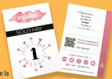
Día de la madre