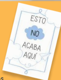
Día de todos los Santos

Este año a partir de marzo tendremos 4 diferentes libros misioneros: Salud física, Salud emocional, salud espiritual y salud familiar